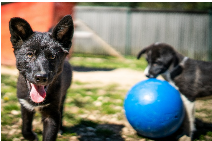
Söta valpar är naturligtvis lättare att hitta hem till, än vuxna hundar