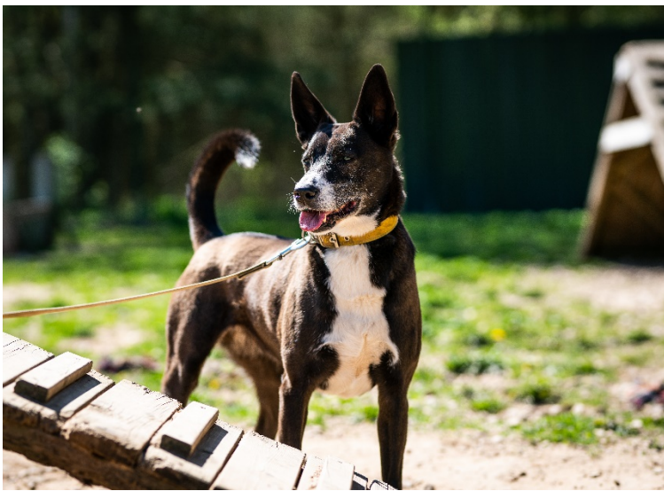
Rastgårdarna är stora och fina, här har hundarna det aldrig tråkigt