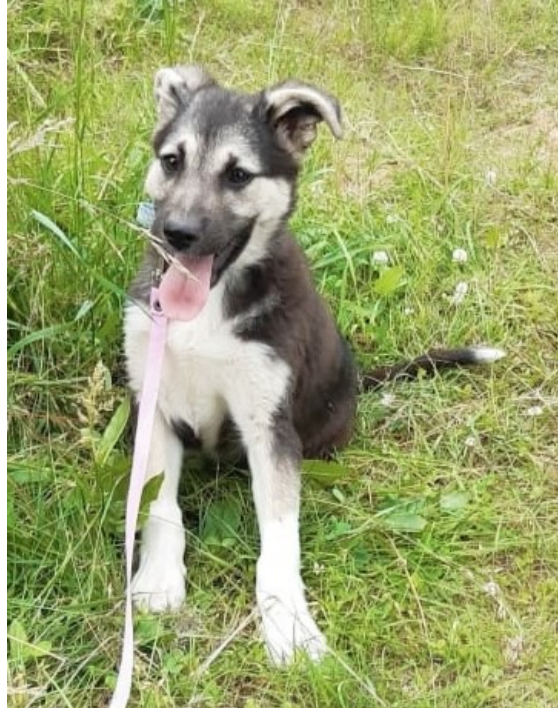
Valpen som nu är omplacerad i sitt nya hem.