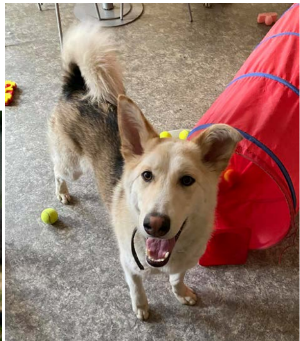
Alla hundar tränas på olika sätt för att klara av att komma till en ny familj